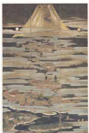
狩野元信 『富士参詣曼荼羅図』

ここでもう少し歴史を遡り、室町時代に狩野元信が描いた「富士参詣曼荼羅図」を見てください。