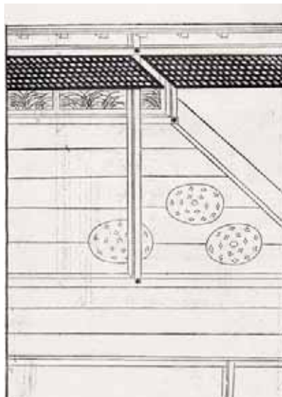
『法然上人行状絵図』

ここに描かれているのは柱と梁と床板、そして3枚の丸い座布団でしかありません。実にシンプルな絵です。