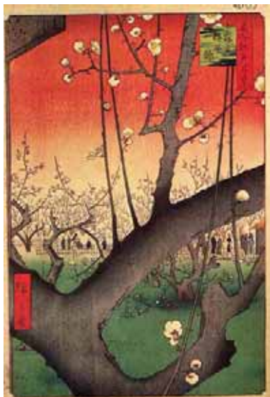
歌川広重の「名所江戸百景」『亀戸梅屋舗』

3枚目は同じシリーズの『亀戸梅屋舗』です。これはゴッホが模写したことで有名な浮世絵ですが、ここでも広重は『四ツ谷内藤新宿』と同様に大胆な構図で、開きはじめて梅の花の香りを感じさせようとしています。