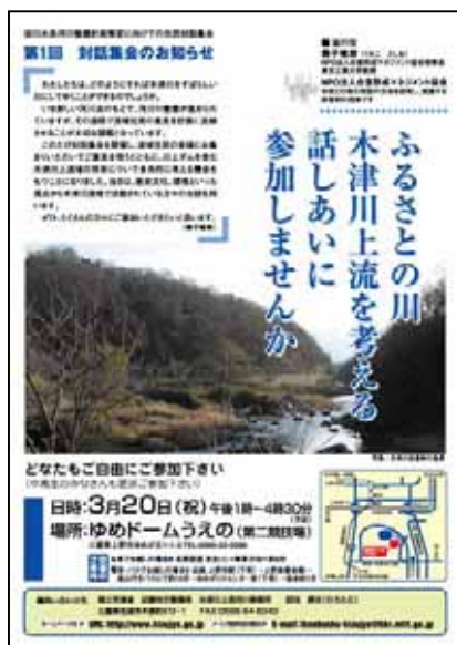
ポスター対話集会ふるさとの川 木津川上流を考える 話し合いに参加しませんか

通常の住民参加集会の告知では、テーマと場所や時間だけを示す紋切り型の案内になりがちですが、それでは最初から対立を煽ってしまいます。したがって私たちは、「ふるさと