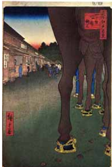
歌川広重の「名所江戸百景」 『四ツ谷内藤新宿』

ここでは、近くにいる馬を大きく描いていますし、そして左の町並みを見ていただければわかるように明らかに遠近法を採用しています。