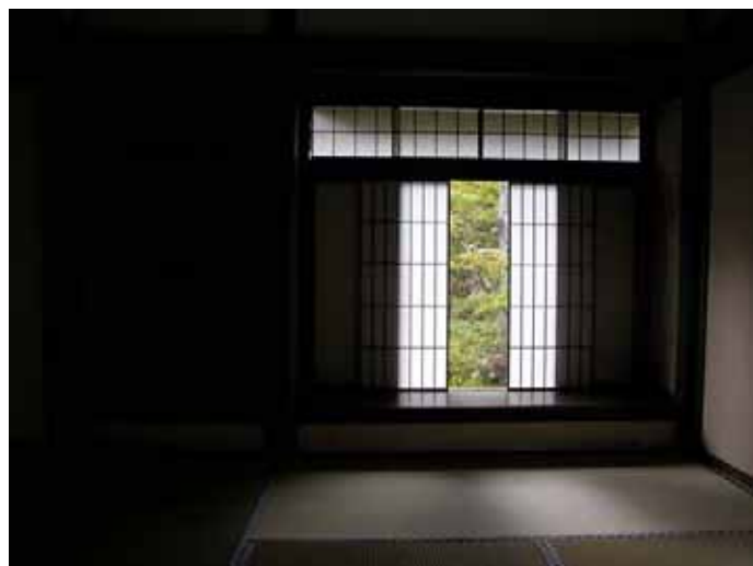
対等平等な討議空間 慈照寺東求堂同仁斎

そういう仕組みの中で頻繁に行われたのが「寄り合い」です。その寄り合いの場所としてもっとも有名なのが、慈照寺、つまり銀閣寺にあります同仁斎という四畳半の部屋なのです。